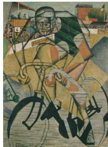
Jean Metzinger, Al velodromo , 1912 Olio e collage su tela Collezione Peggy Guggenheim, Venezia.

L'opera "Al velodromo" illustra gli ultimi metri della famosa corsa ciclistica Parigi-Roubaix e raffigura Charles Crupe-landt, vincitore dell'edizione del 1912. La Parigi-Roubaix si è